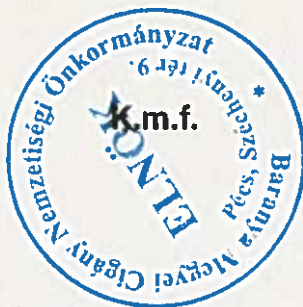
Orsós Ferenc a közgyűlés elnöke

A közgyűlés elnöke további hozzászólás, észrevétel nem lévén a közmeghallgatás vendégei, az érdeklődő állampolgárok részvételét megköszöni, az ülést bezárja, mindenkinek áldott, békés karácsonyi ünnepeket kíván.